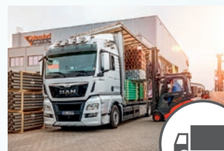
Transport der Ware